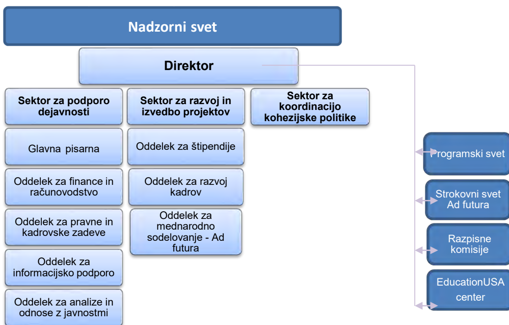
Slika 2: Organizacijska shema sklada

Sklad je statusno pravno javni finančni sklad. Organa sklada sta nadzorni svet in enočlanska uprava – direktor.