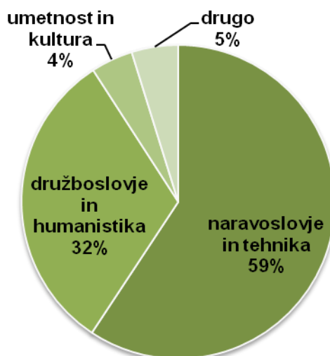
Slika 2: Delež štipendistov in upravičencev glede na področje od leta 2002 dalje

V nadaljevanju so podrobneje predstavljeni tudi rezultati nekaterih razpisov.