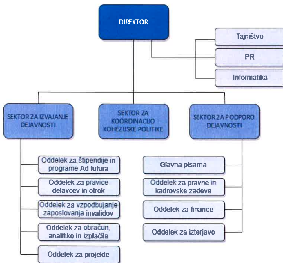
Slika 2: Organizacijska struktura Javnega štipendijskega, razvojnega, invalidskega in preživninskega sklada Republike Slovenije

V okviru sklada deluje tudi Education USA center in sicer kot informacijska pisarna, ki zagotavlja informacije o vseh akreditiranih visokošolskih institucijah v ZDA. Education USA center je akreditiran in finančno podprt s strani ameriške vlade.