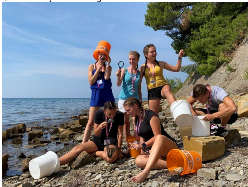
Slika 3: Ekipa študentov