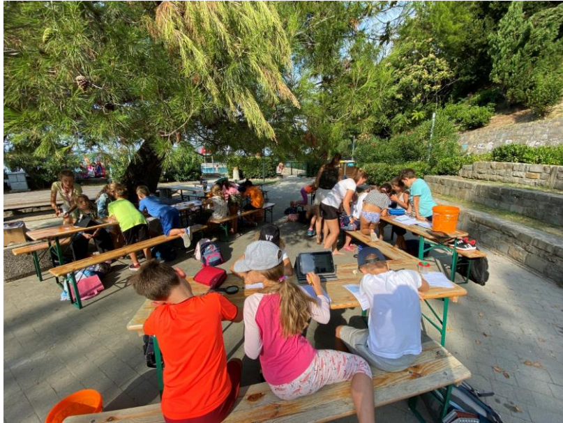
Slika 2: Določanje morskih organizmov z interaktivnimi določevalnimi ključi