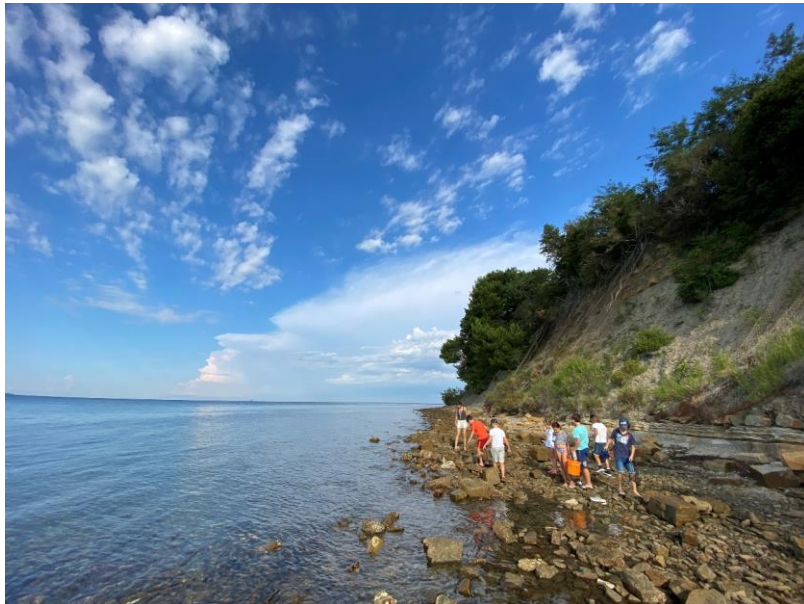
Slika 1: Raziskovanje morske obale